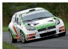
J.-S. VIGION / P. LESCLOUPE Fiat Punto 52000