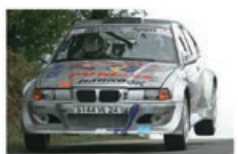
A. MORA / F. BLANCHARD BMW 318 Compact