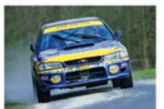
P. ROCHE / M. ROCHE Subaru Impreza