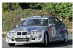
A. MORA / F. BLANCHARD BMW 318 Compact