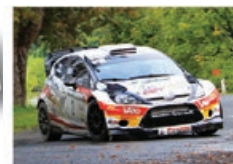
E. BRUNSON / C. MONDON Ford Fiesta WRC