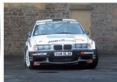
A. MORA / J.-L. MAURY BMW 318 Compact