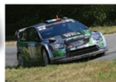
J.-Ch. BEAUBELIQUE / J. VIAL Ford Focus WRC