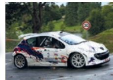
W. FAUCHER / T. PETIT Peugeot 207