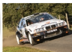
A. MORA / J.-L. MAURY BMW 318 Compact