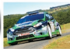
J.-Ch. BEAUBELIQUE / J. VIAL Ford Fiesta