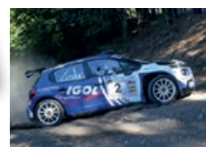
B. VAILLANT / A. BRULE Citroën C3