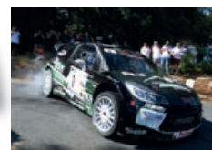
J.-Ch. BEAUBELIQUE / J. VIAL Citroën DS3 WRC