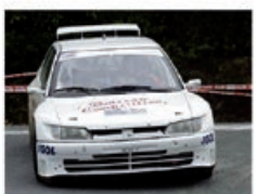
B. LONGEPE / D. GOURET Peugeot 306 Maxi