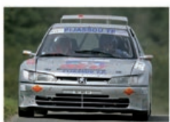
D. PIJASSOU / L. DUBOIS Peugeot 306 Maxi